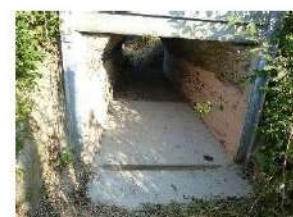
Site de stockage de la Gauteraie à Brain sur Longuenée : rejointement des murs du perthuis

Le Syndicat intervient sur l'ensemble du bassin versant de l'Oudon. contact@bvoudon.fr ; 02 41 92 52 84 ; www.bvoudon.fr