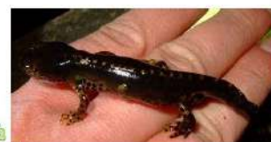
Suivi de 13 mares communales – ici à Peuton