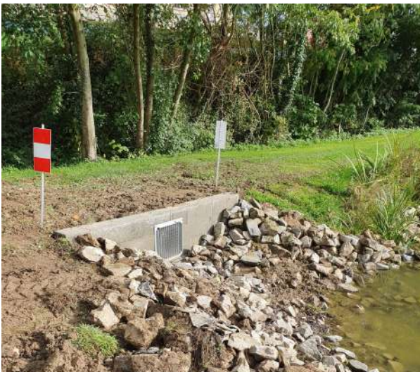
Rénovation du trop plein du plan d'eau