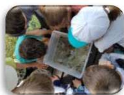
Animations auprès des jeunes à Méral, Renazé, Challain la Potherie et Chazé sur Argos

Le schéma ci-dessous illustre quelques interventions récentes du Syndicat. Pour en savoir plus, visitez le site Internet www.bvoudon.fr et abonnez-vous à notre newsletter (6 à 8 numéros/an).