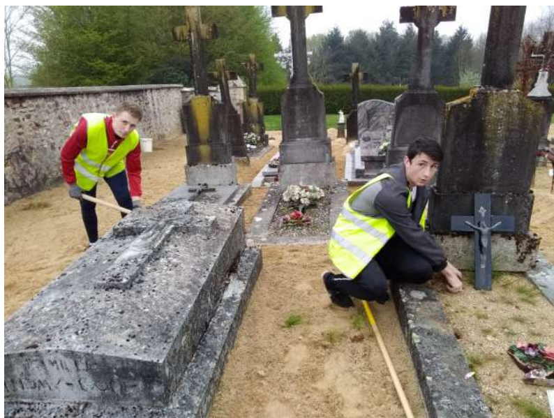
Opération « Argent de poche » au cimetière