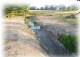
Restauration de l'Argos à Challain la Potherie