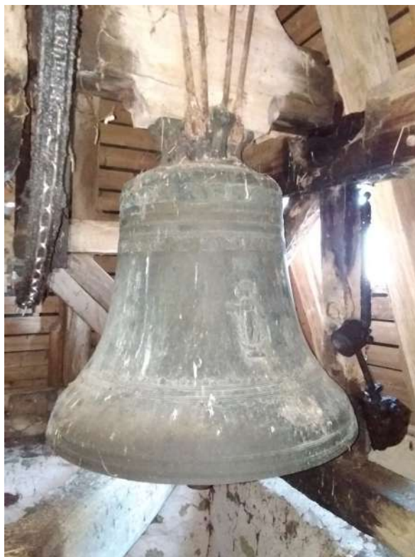
Réparation de la cloche de l'église