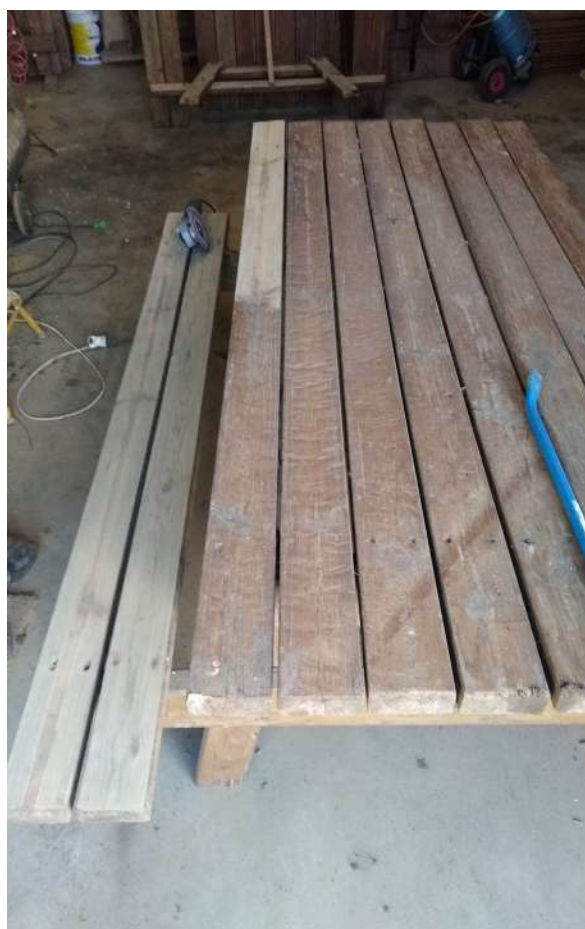
Réparation des tables du terrain de loisirs