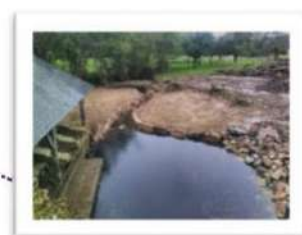
Restauration de la continuité écologique sur la Sazée à Louvaines