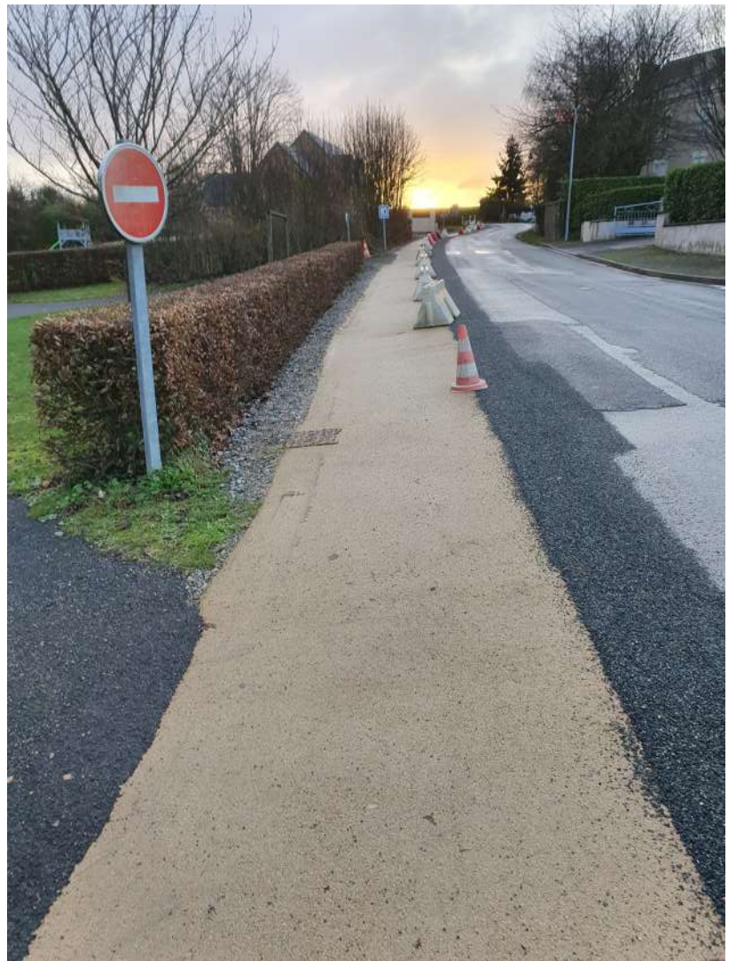
Création d'un cheminement sécurisé Route de Denazé