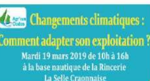
Organisation de journées techniques pour les élus, agents de collectivités, vendeurs en jardinerias, agriculteurs,...