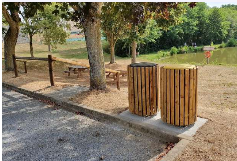
8 Mise en place de poubelles au plan d'eau