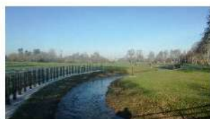
Reméandrage de la Mée et plantations à Livré la Touche