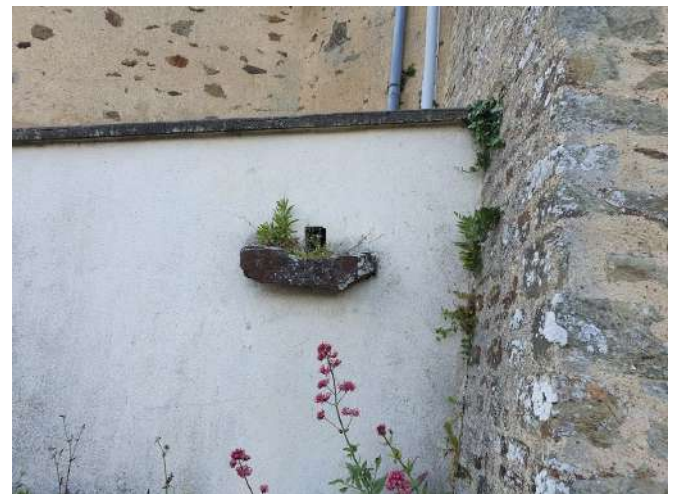
Réparation des gouttières de l'église