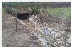
Restauration du lit mineur – affluent de la Verzée à Soudan