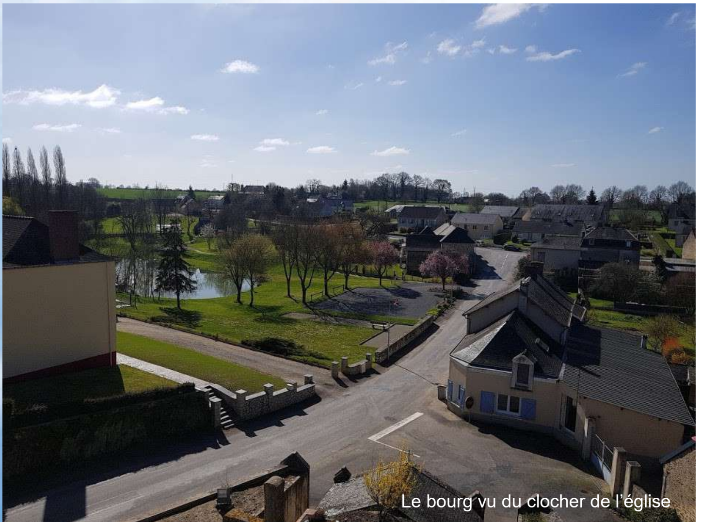
Le bourg vu du clocher de l'église