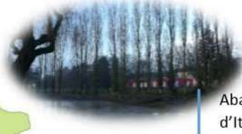
Abattage de peupliers d'Italie à Montjean