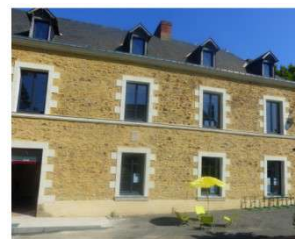
Maison des Jeunes (MDJ)

Pendant les vacances, du lundi au vendredi de 10h00 à 18h00