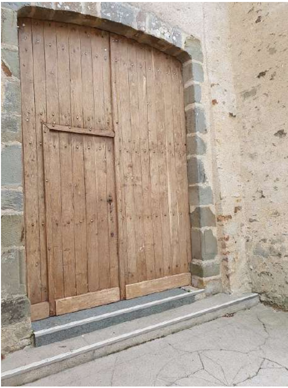
Rénovation des portes de l'église