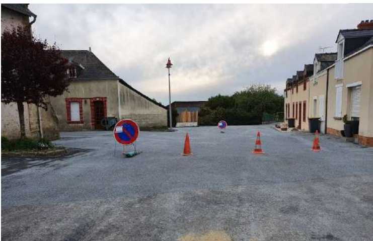
Goudronnage de la place de l'église