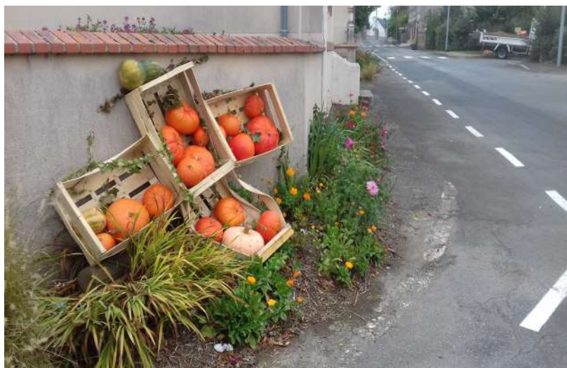
Fleurissement du bourg